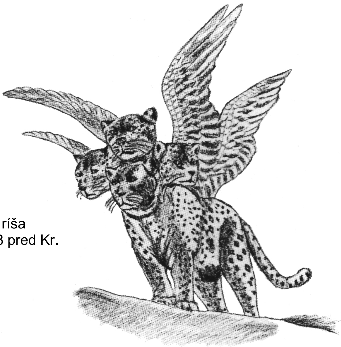
Grécka ríša 331-168 pred Kr.

Víťazné ťaženie Alexandra nemohlo byť lepšie znázornené ako lietajúcim leopardom. Neohrabaný medveď nemá šancu proti okrídlenej mačkovitej šelme. Avšak táto rýchlo dobytá ríša nemala dlhé trvanie. Po Alexandrovej smrti sa rozpadla do viacerých častí, ako to symbolizujú štyri hlavy lúpeživého zvieraťa.