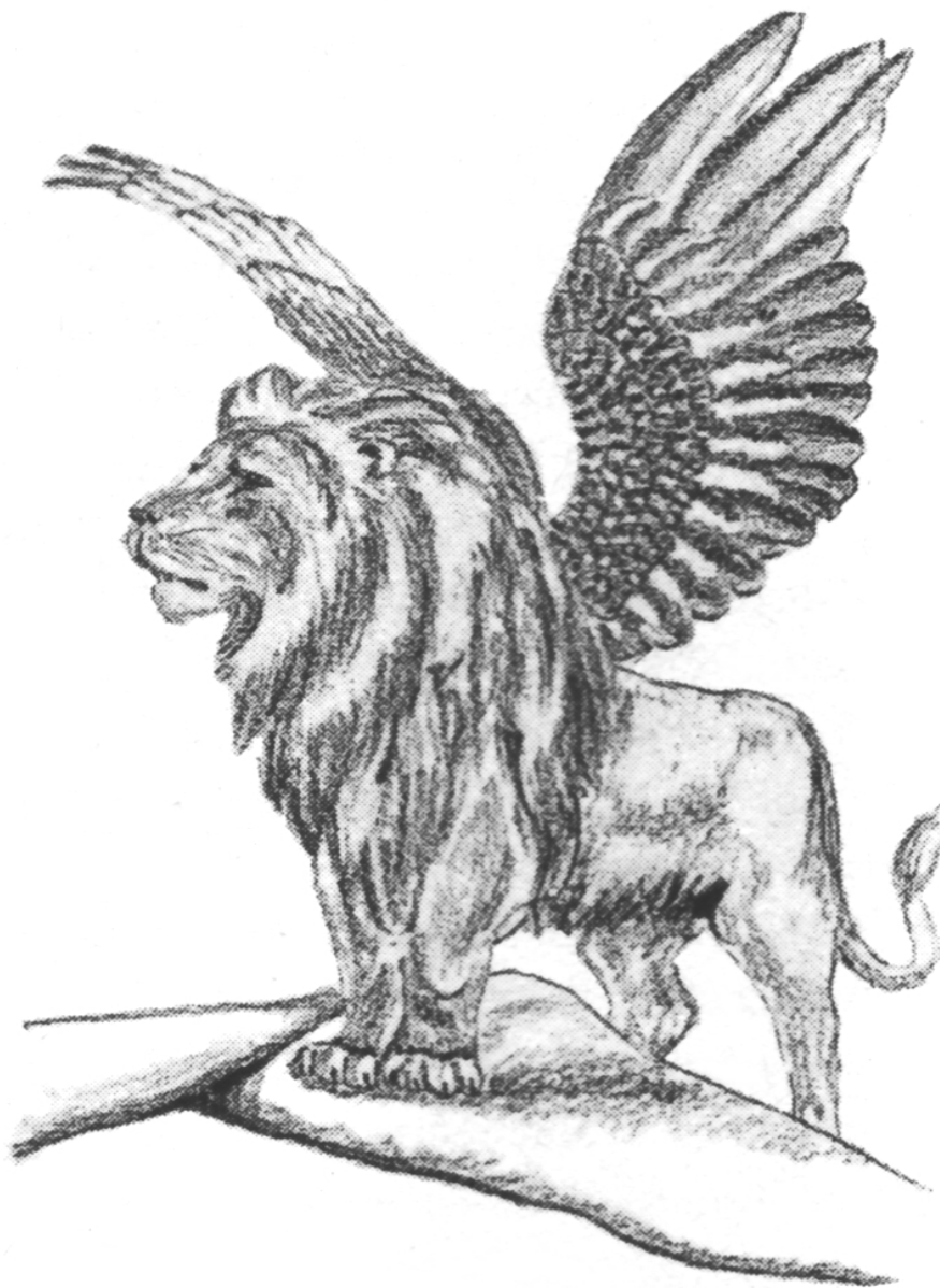
Babylonská ríša 605 - 539 pred Kr.

„Prvé bolo jako lev a malo krídla orla.“ Daniel 7,4. Tak ako je zlato najvzácnejším kovom, tak lev je označený ako kráľ zvierat. Nie je možné prehliadnuť paralelu s 2. kapitolou knihy Daniel. Babylonská ríša naozaj spájala moc, silu a krásu leva s rýchlosťou a obratnosťou orla. Ako vieme, táto ríša padla v r. 539 pred Kr. pod náporom Médov a Peržanov.